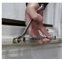
レンチを使用して取付

ブラインドナットの取付け専用工具「レンチ式ナッタープラス」でも取付けが可能。少し力はいりますが、低コストながらしっかりと取付ける事ができます。 ※ご使用にはメガネレンチ2本が必要です。