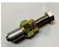
レンチ式ナッタープラス (ステンレス製)